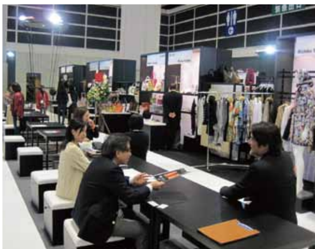
国際ファッションセンターが出展したブース

組合連合会が団体出展し、メインのレッグ商品にとどまらず、その高度な生産技術をいかした多様な商品を全世界に紹介しました。