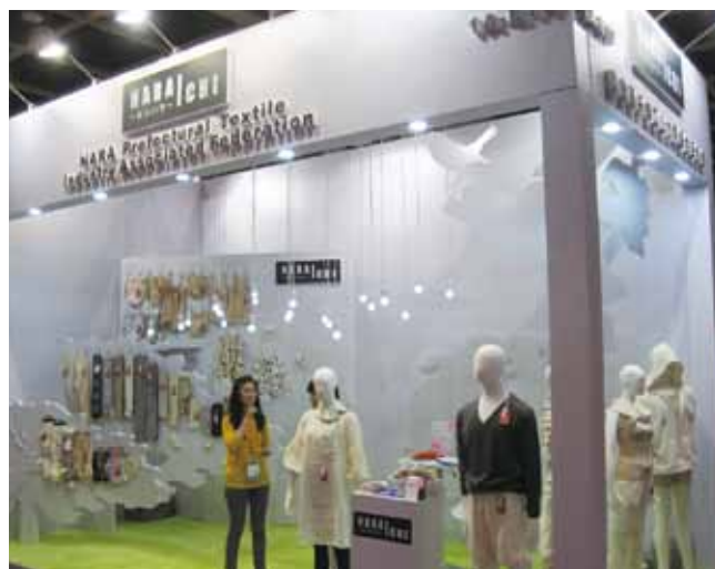
奈良県繊維工業協同組合連合会ブース