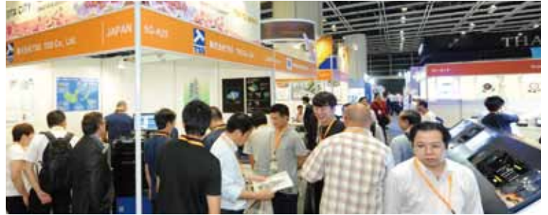
大田区のパビリオン