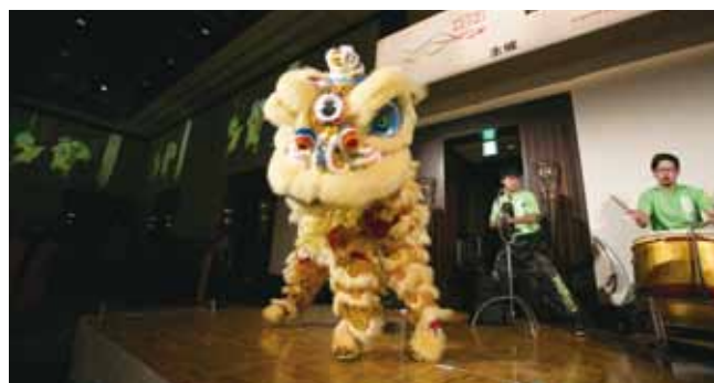
横浜中華学校校友会国術団による獅子舞