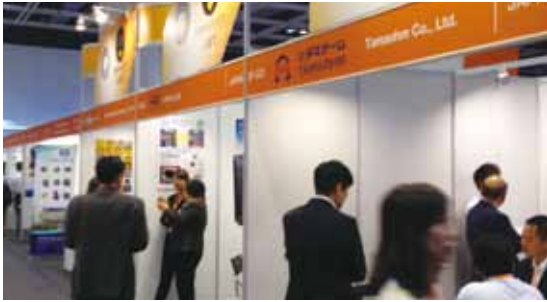
川崎市のパビリオン