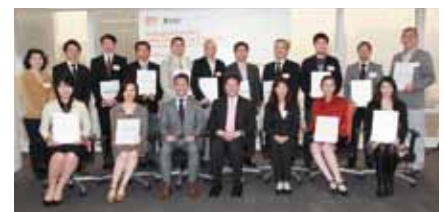
香港での修了証授与式

ネス攻略のためのノウハウ、華人ビジネスの特徴や人脈構築の秘訣なども教授していただきました。医薬品、化粧品、食品、映画コンテンツ、アパレルなど幅広い業界から応募された全国の計13名が参加されました。