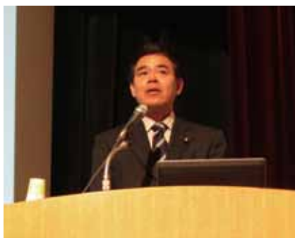
大久保勉・財務副大臣

世界的な経済減速感が強まるなか、香港の金融機能が改めて脚光を浴びています。資金調達場としてはもちろんのこと、香港を経由した中国・アジア諸国への再投資という動きがより顕著となり、その重要性・存在感が高まっています。3都市で行われた金融セミナーには計378人が参加、金融センターとしての香港への大きな期待がみられました。