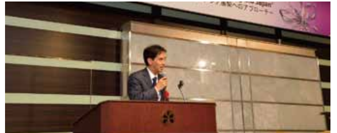
経済産業省商務情報政策局メディア・コンテンツ課長 伊吹英明氏