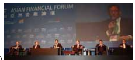
右から二人目は中尾武彦財務省財務官(現・アジア開発銀行総裁)

て活発な議論が行われました。日本からは前年の2倍を超す64名が参加。デールフローと呼ばれる投資商談会にも、うち27名が参加されました。