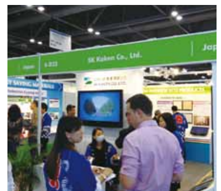
エコ・エキスポ・アジア会場

および香港の日系企業に働き掛け、関東・関西・九州などで香港環境ビジネスフォーラムを開催してきました。その結果、10月末に香港で開催した「エコ・エキスポ・アジア」には、建材塗料大手のエスケー化研ほか、多数の日系企業が出展しました。さらに、2013年2月には、川崎にて開催した「川崎国際環境技術展」に多数の香港企業が参加し、日本企業との連携を模索しました。