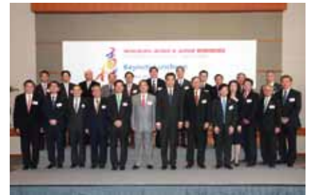
C.Y.リョン行政長官(前列中央)と財界代表団

年に設立され、香港貿易発展局と一般社団法人日本経済団体連合会が各方の事務局を務めています。会議後の昼食会には、香港特別行政区政府のC.Y.リョン(梁振英)行政長官が参加し、日本代表団の来訪を歓迎するとともに、双方の関係強化に強い期待が述べられました。