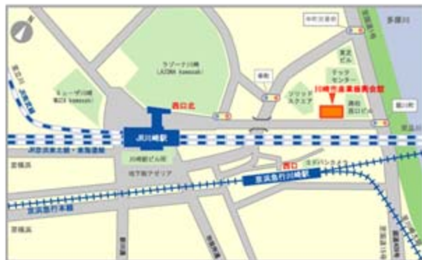
※当館をご利用の際は、電車、バスをご利用ください。 JR川崎駅から徒歩8分、京浜急行川崎駅から徒歩7分