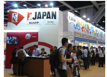
世界のバイヤーが集まるジャパン・パピリオン

メーカーが出展、ポルトガルパピリオンの隣という好立地も相まって、初日から大勢のバイヤーが詰め掛けました。既に人気が高い日本酒や日本産ウイスキーのほか、日本産のワインや地ビールにもバイヤーの関心が集まりました。香港はアルコール度数が30度未満の酒類に関しては免税で輸入ができるため、海外展開におけるハブとしての機能を果たしております。