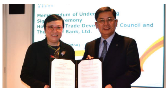
株式会社十六銀行 2016年1月18日<香港>