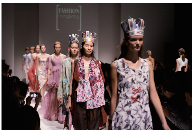
大にぎわいとなったランウェイ・ショー

各種プロモーションを行いました。14日には5人の香港デザイナーによる合同ランウェイ・ショーを渋谷ヒカリエで行い、メディアやバイヤーなどファッション業界から想定を上回るご来場者を迎え盛況を博したほか、コレクション作品の展示や国内バイヤーとの商談会も実施し、アジアのファッショントレンドセンターとしての香港をアピールしました。