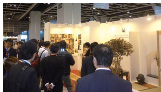
多くのバイヤーが注目するIDTEの「日本の和室」

香港人の訪日旅行者数は2015年に約150万人と過去最高を記録しました。日本を訪れる香港人の中では近年、日本の伝統的な旅館に泊まるのが流行しています。こうした背景もあり、香港ではここ数年、「和住空間」が静かなブームになりつつあります。香港貿易発展局主催『イノベーション・デザイン&テクノロジー・