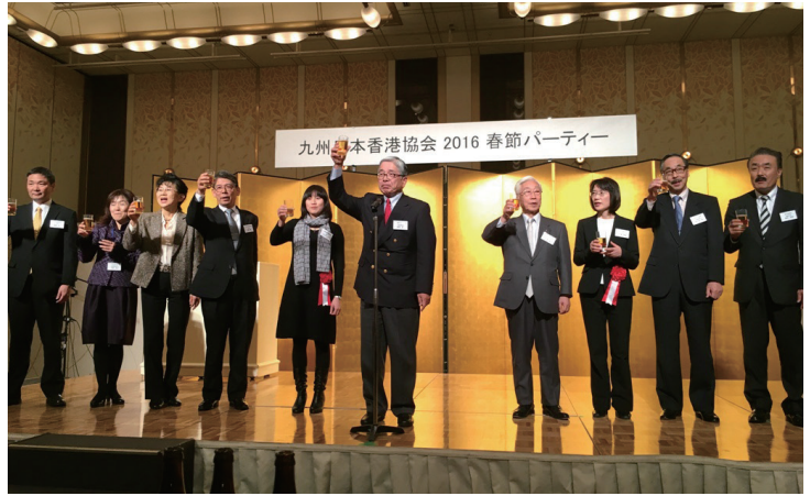
2月3日の九州日本香港協会の春節パーティーから各地のイベントがスタート

2月から3月にかけて、毎年恒例の春節イベントが日本全国に広がる各地域協会により開催されました。日本香港協会は北海道から沖縄まで全9協会が活動しており、日本と香港の友好親善を深めるとともに、ビジネス支援をするためのネットワーク組織です。各地のセミナーでは中国政府の新政策である「一帯一路（シルクロード経済圏）」に関するテーマを掲げて講演。その実情や将来的に生まれくるビジネスチャンスについて考える内容となりました。各地のパーティーでは地元の政界・財界からの参加者も多く、例年以上に盛り上がったイベントとなりました。