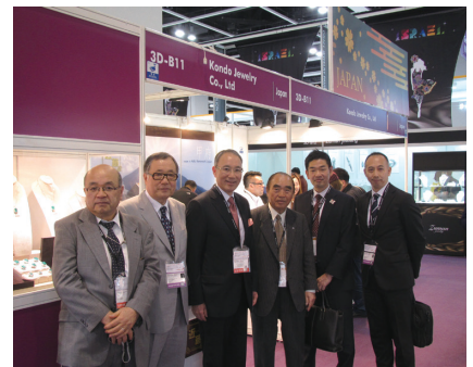
松田邦紀・在香港日本国総領事館総領事（大使）（中央左）がジャパン・パビリオン（製品展）をご視察