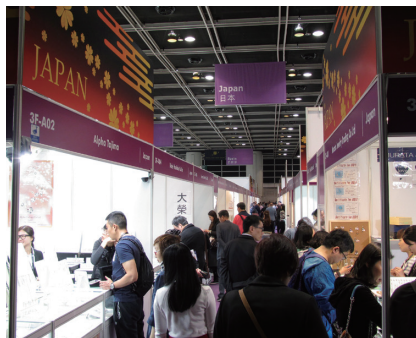
100社が出展したジャパン・パビリオン（製品展）