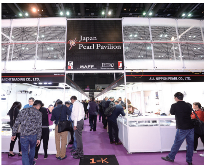
103社が出展したジャパン・パール・パビリオン（素材展）

ュエリー協会によるジャパン・パビリオン（100社）がそれぞれ前回は上回る規模で設けられ、多くのバイヤーで連日大にぎわいとなりました。会期中には、パレード・ショーやセミナー、ネットワーキングイベントなども多数開催されました。なお、2015年の日本のジュエリー対外輸出2938億円のうち香港向けは1163億円（シェア39.6%）と、1999年以来17年連続で香港が輸出先トップとなりました。香港は現在、世界最大の宝飾品取引拠点としての地位をいっそう強固にしています。