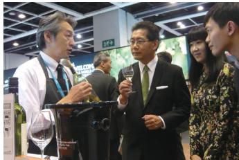
蘇錦樑（グレゴリー・ソー）香港政府商務経済発展局長が製品説明する山梨ワインの出展者

香港貿易発展局主催『香港インターナショナルワイン&スピリッツ・フェア』には、32カ国・地域から1065社の出展と75カ国・地域から2万0394人のバイヤーが集結しました。第9回目となる今回は、ポルト