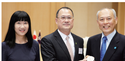
舛添要一・東京都知事 (右) への表敬訪問

本経済委員会委員長率いる香港からの委員団は、前日の22日、東京都庁で舛添要一・東京都知事、経済産業省で北村経夫・経済産業大臣政務官、農林水産省で森山裕・農林水産大臣らと会見。また、六本木ヒルズクラブで昼食会、八芳園で夕食会をそれぞれ行い、日本の産業団体や財界代表者らと交流しました。