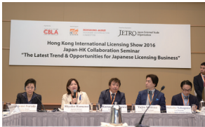
「日本－香港コラボレーションセミナー」

香港貿易發展局が主催するアジア最大規模のライセンスビジネス展示会『香港国際ライセンスショー』には、独立行政法人日本貿易振興機構（ジェトロ）と一般社団法人キャラクターブランド・ライセンス協会（CBLA）の共同運営による過去最大規模（40小間）のジャパン・パビリオンが出展し、アジアを中心とする世界各国のバイヤーが活発な商談を行いました。同時開催の『アジアライセンス会議』では、横尾英博・内閣官房知的財産戦略推進事務局長