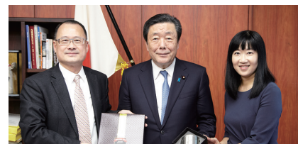
森山裕・農林水産大臣 (中央) への表敬訪問