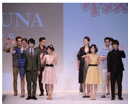
FORTUNA Tokyoの映画タイアップイベント