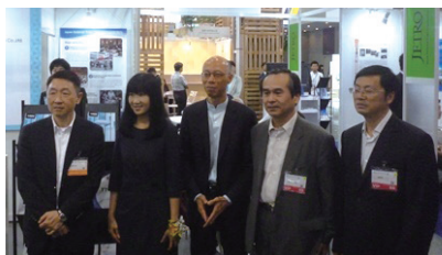
黄錦星（ウォン・カムシン）香港環境局局長がジャパンパピリオンを訪問、日本の環境技術に高い関心を示した

香港は、一般ごみの処理、ビルの省エネ化、自動車からの大気汚染等の環境問題に直面しており、政府がこれらの分野に対し、異例の助成金を拠出することになりました。毎年10月に香港にて開催される香港貿易発展局主催の環境ビジネス展示会『エコ・エキスポ・アジア』に、日本からグリーン・ビル、植物工場、廃棄物処理業者など14社が出展し