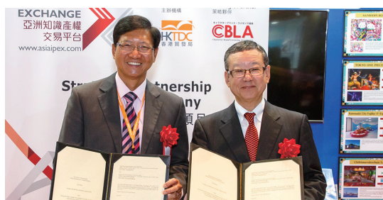
一般社団法人キャラクターブランド・ライセンス協会 2016年1月11日<香港>

香港貿易發展局では、日本の中央省庁、経済団体、地方自治体、金融機関などからの要請に基づき、業務協力覚書 Memorandum of Understanding (MOU) を締結しています。日本各地の優れた商品、技術、サービスの市場を香港経由で中国・アジアそして全世界へと拡大するのが狙いです。香港をビジネスのプラットフォームとして活用し、海外市場を開拓する動き、地域間の交流を活性化する動きが加速しています。