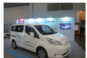
「グリーン・トランスポートーション」の需要が高まり、各国からエコカーが出展された

ました。今回は、独立行政法人日本貿易振興機構（JETRO）香港事務所と共催で、香港政府の環境調達や香港における環境ビジネスの可能性などについて、日本の出展社向けにブリーフィングを行ったほか、香港有力バイヤーとのネットワーキングのための「ジャパン・ナイト」を初めて開催しました。10周年を迎えた本展示会には、18カ国・地域から320社が出展、97カ国・地域から1万2300人以上（前年比14.5%増）のバイヤーが訪れました。