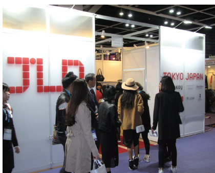
来場者が多数訪れたJLDブース

登場し、香港・海外の多数のメディアの注目を集めました。また、株式会社パルコと株式会社バンタンが主催し、香港貿易發展局が後援する形で、アジアの有能なデザイナーを発掘するインキュベーションプロジェクト「Asia Fashion Collection」の展示も行われました。国際ファッションセンターがサポートするデザイナー11人を含め、合計24社が出展、日本の高感度・高品質のファッション・アイテムが効果的にアピールされ、世界各国のバイヤーと活発な取り引きが行われました。