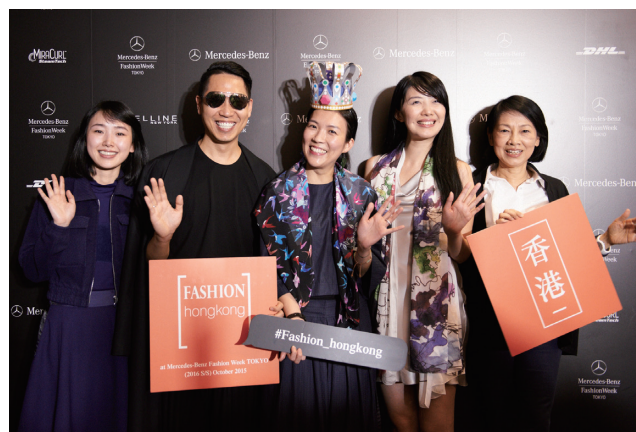
ショーに参加した香港デザイナー