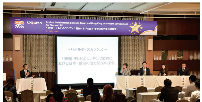
「香港コンテンツ・エンターテインメント産業セミナー」での討議風景