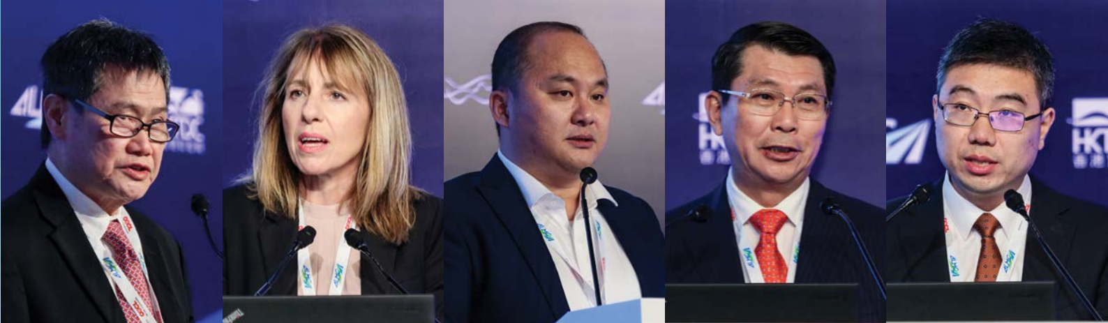
林玉辉 拿督 东南亚国家联盟 秘书长